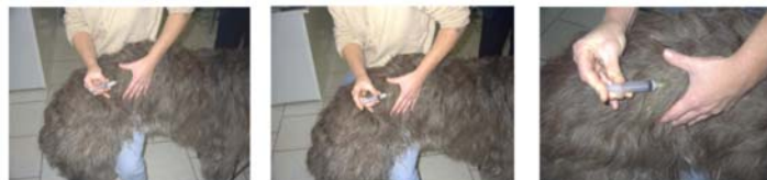
Injection IM 5 ml côté droit (position 2)